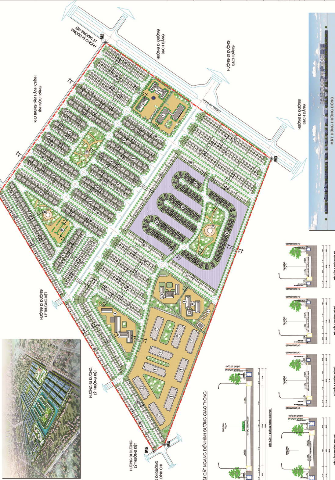
MẶT CẮT NGANG ĐIỂN HÌNH ĐƯỜNG GIAO THÔNG